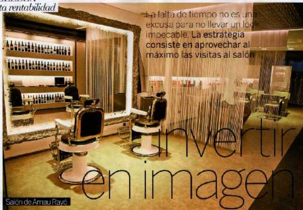
Salón de Arnao Rayó

La falta de tiempo no es una excusa para no llevar un look impecable. La estrategia consiste en aprovechar al máximo las visitas al salón.